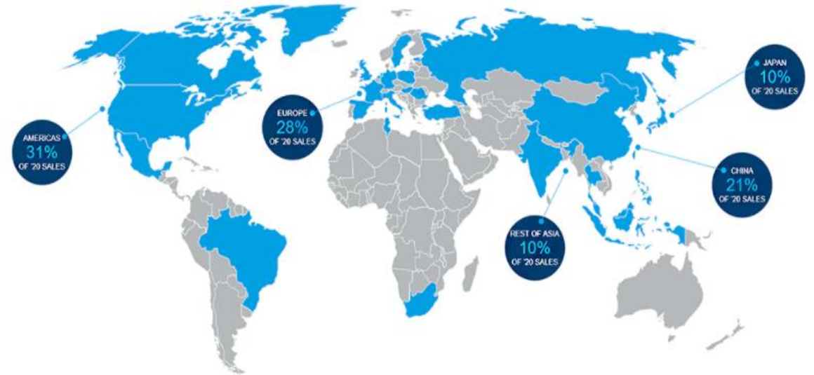
Rysunek 1. Sprzedaż Grupy Autoliv w podziale na regiony w 2020 r.